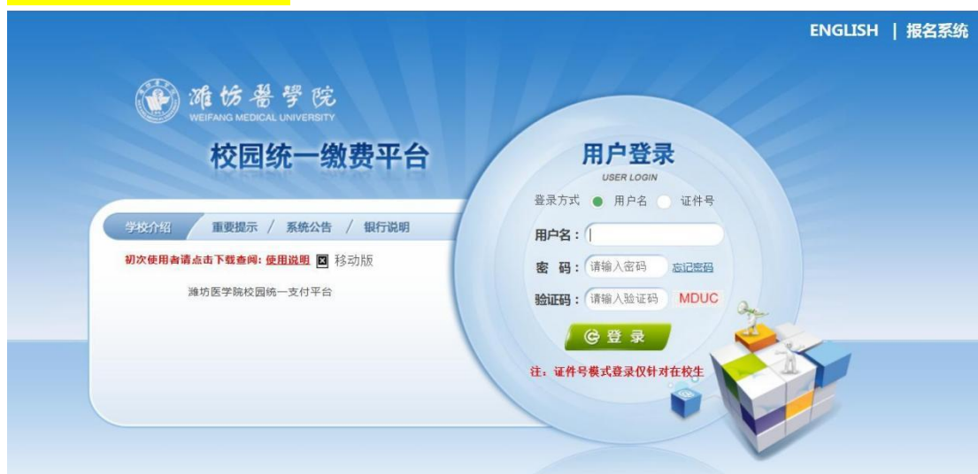
图 1-1 统一支付平台登陆界面

在浏览器地址栏输入 http://tyzfpf.wfmc.edu.cn/xysf/ ， 如图 1-1 所示。