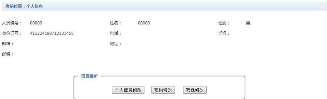
图 2-1 个人信息维护界面

登陆支付平台后，点击导航栏的个人信息按钮，显示个人信息确认及维护界面。如图 2-1 所示。 请确认个人信息无误后再进行缴费，避免误交费。