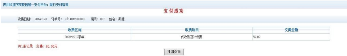
图 3.1-6 支付成功