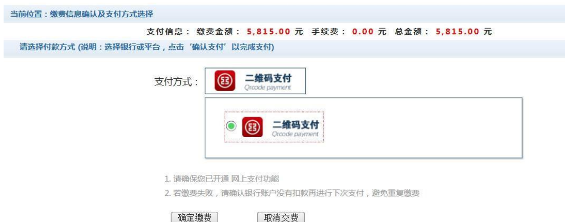
图 3.1-4 缴费方式选择

d. 缴费信息确认及缴费方式。如图 3.1-4 所示。确定支付金额无误后，选择二维码支付。