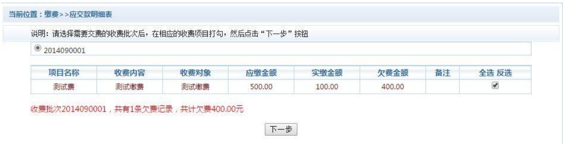
图 3.2-1 其他零星欠费

点击导航栏的“其他缴费”按钮，进入其他零星缴费显示和 选择页面，如图 3.2-1 所示。