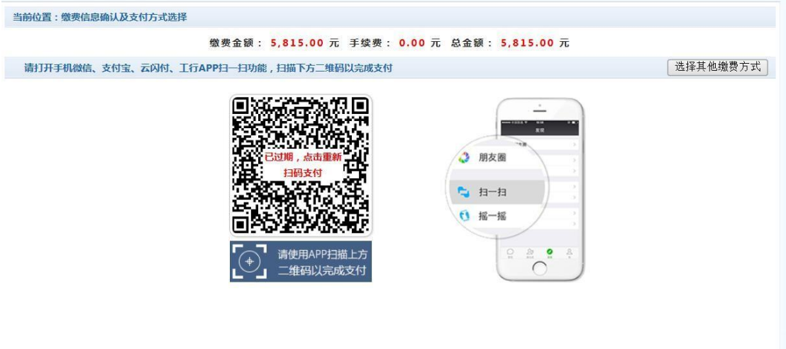
图 3.1-5 网上支付

e. 点击确定缴费后，将会弹出二维码，请使用微信、支付宝、云闪付、工商银行 APP 扫一扫进行扫码支付，如图 3.1-5 所示。 注意：请确认商户名称： 潍坊医学院